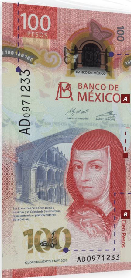
LU XTI' GUI'CHI' BIDXICHI XI MODO GU'CA COLONIA